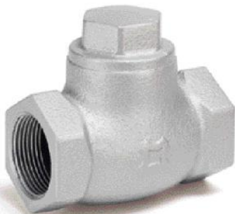
FIG 69D(SUS Disc) FIG 69D-G(Viton Disc)