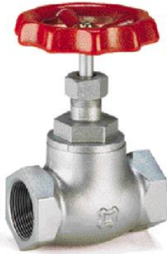
FIG 39D(SUS Disc) FIG 39D-G(Teflon Disc)